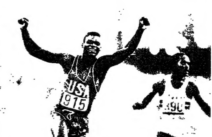
كلر لويس صاحب الذهبات الاولمبية الرابع